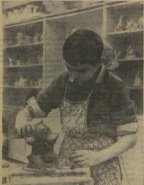
«ЮНЫЙ СКУЛЬПТОР». Этот снимок сделал Витя Антонов из Москвы.